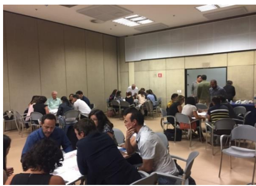
Oficina de aplicação dos conceitos