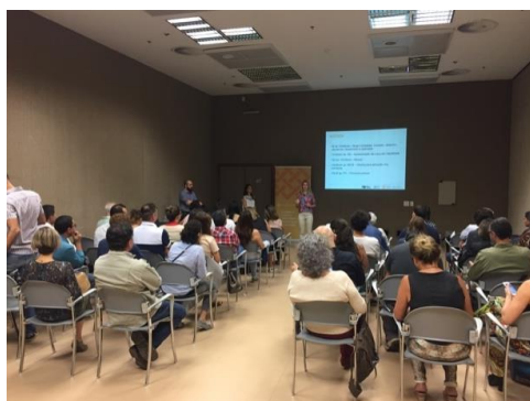
Apresentação dos conceitos de Ruas Completas

Sobre a rua: Avenida da região administrativa de Planaltina, situada a 40km do plano piloto, culminando na BR-030, rodovia que conecta a área com Brasília. A Avenida articula a área histórica da cidade com diversos usos institucionais, além de ser uma área de comércio tradicional. Dessa forma, ela possui um fluxo significativo de carros, ônibus e pedestres. A avenida possui um canteiro central bastante arborizado que se estende por toda sua extensão de norte a sul. O uso do solo no lado oeste é predominantemente comercial com quadras curtas, enquanto o lado leste possui quadras longas com a presença de equipamentos públicos. Um dos principais desafios do projeto é a melhoria das condições de acessibilidade, com o alargamento das calçadas e a inserção de uma ciclovia posicionada no canteiro central, conferindo conforto e segurança aos pedestre e ciclistas.